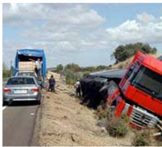
Andalucía reduce un 47,7% el número de muertos en carretera del 2002 al 2009