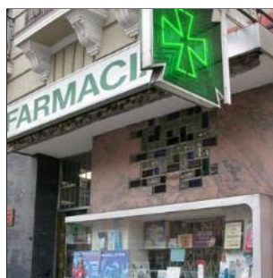
Ampliar la imagen

Además, recoge los principios activos considerados más adecuados para cada síntoma menor y especifican los medicamentos comercializados sin receta médica en España que contienen dicho principio. De modo que de cada fármaco se proporciona información sobre sus indicaciones y dosis; las precauciones a tomar, incluyendo las principales interacciones; y las pautas para un uso correcto por parte del paciente.