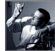
La Farmacia Galénica: base de todos los medicamentos actuales