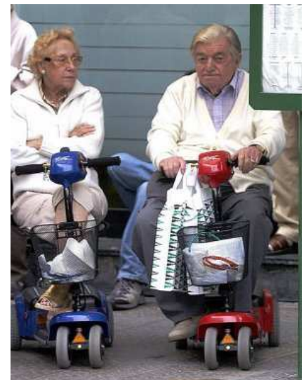
Una pareja se desplaza en vehículos adaptados.

Los expertos consideran que las bajas disminuirían entre el 40 y el 50% si se invirtiera en salud.